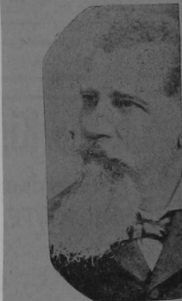
General Bernardo Reyes

Méjico, 6.—A consecuencia de una serie de bochinchos políticos entre reylistas y maderistas, resultaron 5 muertos y 10 heridos.