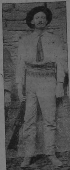
El Jefe revolucionario Orozco

Monterrey, 6.—Informan que el General Orozco se encuentra grave de enfermedad.