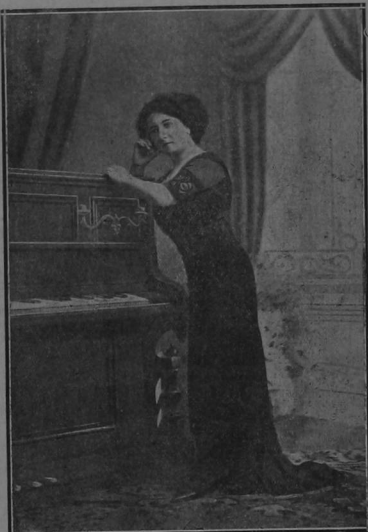
Mañana sábado debutará en el TEATRO VARIEDADES esta notable cantante Romana, Romancista y Canzonetista